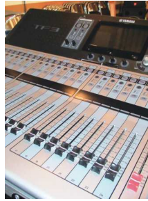
イベント等で大活躍のデジタルミキサー

の皆様、「経営革新計画」を作成してみませんか? 計画を作成し、県の承認を受ける様々な支援策を利用することが出来ます。詳しくは商工会までお問い合わせください。