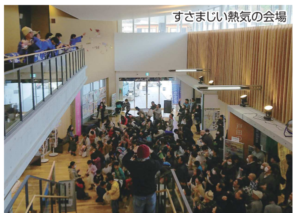
すさまじい熱気の会場

場所は道の駅『くるら戸田』をお借りしました。当日は、開始の30分以上前から地元の子供たちが集まり始め、イベントの始まりをいまかいまかと待ち構えていました。豆まきの開始時間の間際になると、会場には小さなお子さんからお年寄りまでが集結し、異様な熱気