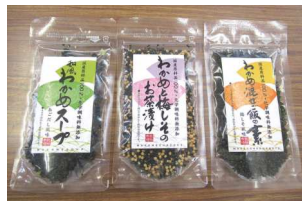
無添加・国産原料品 100%の新商品