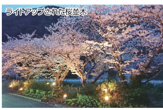
ライトアップされた桜並木

3月31日にはこの桜並木でさくらまつりを開催しました。満開の桜のもとで青年部自慢の焼きそば、焼き鳥、女性部のお汁粉のふるまいと、楽しい出店が軒を連ねました。地元の方を中心に、多くのお客様で賑わいました。