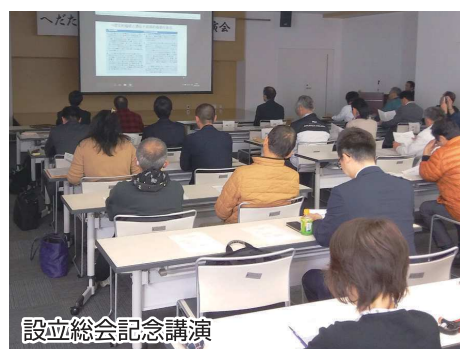
設立総会記念講演

② 桜並木ライトアップ & 夜桜まつり開催! 戸田の中上(なががみ)地区には、桜の並木道があります。毎年、戸田支所青年部が夜桜鑑賞用のライトを設置しています。今年も桜の開花に合わせてライトアップ。車を停めて写真を撮る人が多く見られました。