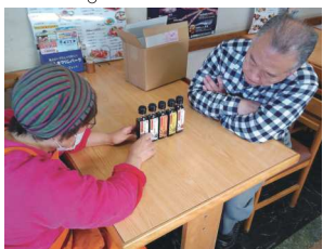
奥様とラブラブで試作品の検討をしている社長